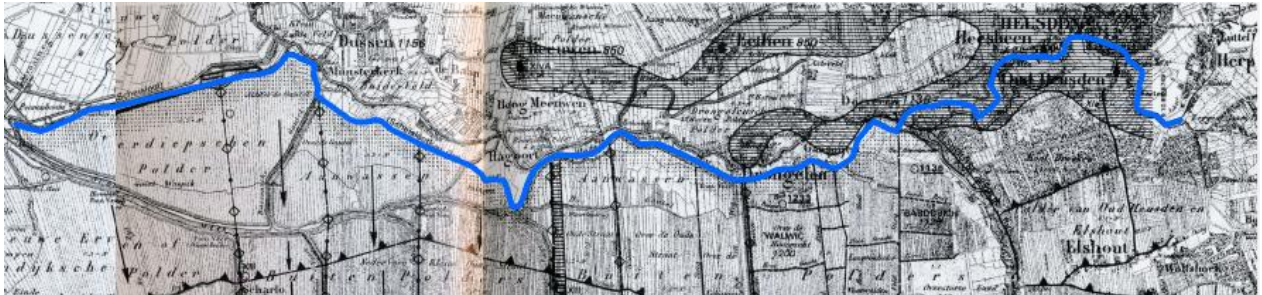
fig. 2: De loop van de Maas op de kaart van De Bont is in blauw gemarkeerd.

De loop van de Maas van Heusden tot boven Geertruidenberg is gebaseerd op de kaart van De Bont 100 . Zoals Leenders 101 de Maas aangeeft, komt dat grotendeels overeen met wat De Bont tekent op zijn kaart. Wel wijkt Leenders af wat betreft het stuk tussen Munsterkerk – Heraartswaarde. De Bont 102 neemt aan dat de Scheisloot 103 daar de loop van de Maas aangeeft voor de overstroming. Ik heb de loop van De Bont aangehouden.