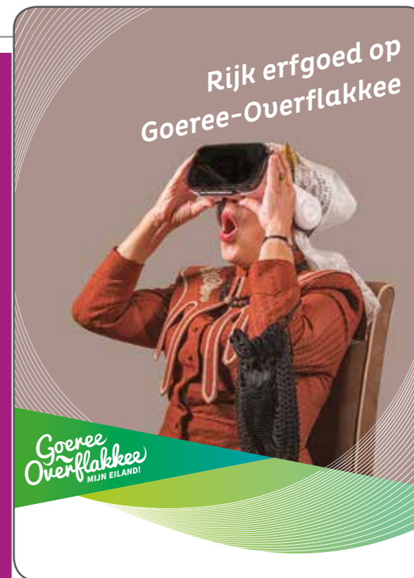
Goeree Overflakkee MIJN EILAND!

De Toren in het stadje Goedereede, voorheen ook een vuurtoren, is te beklimmen. Hier is tevens een charmant museum gevestigd met onder andere een vuurtorenexpositie.