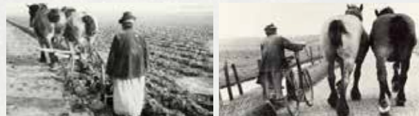
Dit zijn de dames Kleinot "de Kleinotten", karakteristieke figuren uit Dirksland, die in de Christoffel land bebouwden.

De bodem op Goeree-Overflakkee leent zich enorm goed voor akkerbouw. Er is daarom altijd weinig weidegrond op het eiland geweest. Het vee, wat er was, grasde meestal op de dijken. De dijken waren ook een goede plek om geriefhout te telen. Tot op de dag van vandaag staan er daardoor op de dijken vaak bomen en struiken. Deze beplantingen zijn bepalend voor de schaal en intimiteit van het landschap.