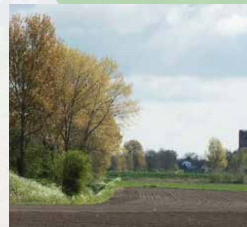
De Christoffelroute over de bloemrijke dijken van de polders tussen Dirksland en Sommeldijk

Vereniging voor Natuur en Landschapsbescherming Goeree Overflakkee Postbus 170 3240 AB Middelharnis Email: Info@nlgo.nl - www.nlgo.nl